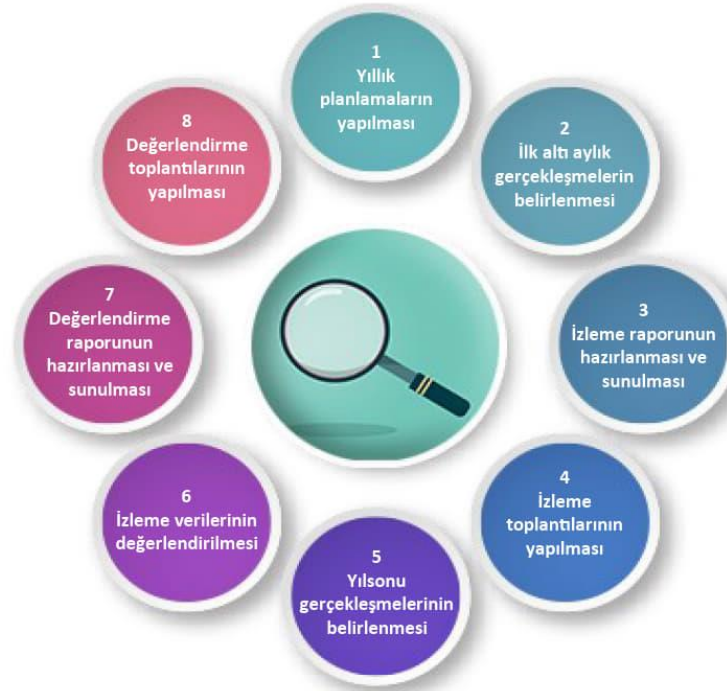
Şekil-4 İzleme ve Değerlendirme Süreci